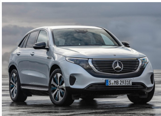
Quellen: ZAL, C.D. Wälzholz, Electrive.net, Airbus, SMS group